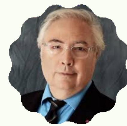
Manuel Castells, Ministro de Universidades