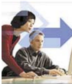
Administración Electrónica @

El Comité indica que la Ley de Administración Electrónica, cuyo debate acaba de co-